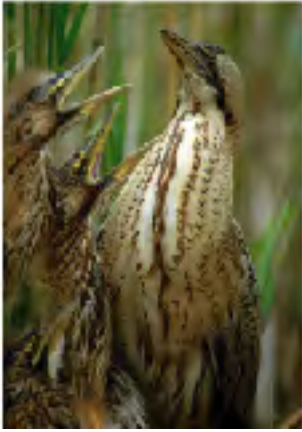
Butor étoilé, Jean-Pierre SALIOU

Tarifs : adultes 4 €, adolescents (12-18 ans) 3 €, enfants 2 €