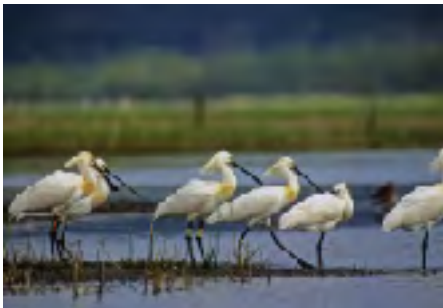
Spatules blanches, Jean-Pierre SALIOU

Cette saison sonne le retour des oiseaux migrateurs. Certains ayant passé l'hiver loin en Afrique auront parcouru 6 à 12 000 Km pour revenir sous nos latitudes et plus au nord encore pour y nicher et renouveler les générations qui perpétueront ces stratégies et ces prouesses physiques. Ou puisent-ils leur énergie? Comment s'orientent-ils? Se ménagent-ils des étapes? Quelles techniques de vol utilisent-ils? Rencontrent-ils des dangers?... Réponses lors de cette sortie !